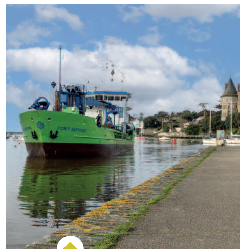
Cinq ans après sa dernière visite, la drague Fort Boyard est revenue le 15 février pour désenvaser le chenal d'accès au port de la Noëveillard.