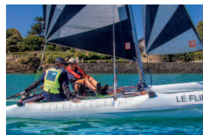
En septembre, le Festival nautique permet de s'initier aux sports nautiques.

Au-delà des événements des clubs, la Ville multiplie elle aussi les initiatives, principalement dans le domaine du nautisme. Elle a créé le Rallye de Gascogne (juin-juillet), Ride in Pornic pour toutes les formes de glisse (juillet) et le Festival nautique (septembre). Elle s'attache aussi à accueillir les grandes