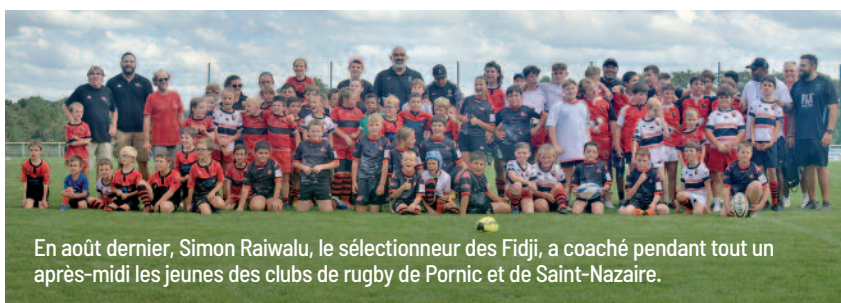
En août dernier, Simon Raiwalu, le sélectionneur des Fidji, a coaché pendant tout un après-midi les jeunes des clubs de rugby de Pornic et de Saint-Nazaire.

équipes en stages de préparation. Après les équipes de France de handball et de judo, et le Stade toulousain, elle a reçu l'an dernier l'équipe de rugby des Fidji. Avec à la clé, un entraînement public et une séance de coaching des jeunes par le sélectionneur lui-même. Décidément, ça bouge à Pornic !