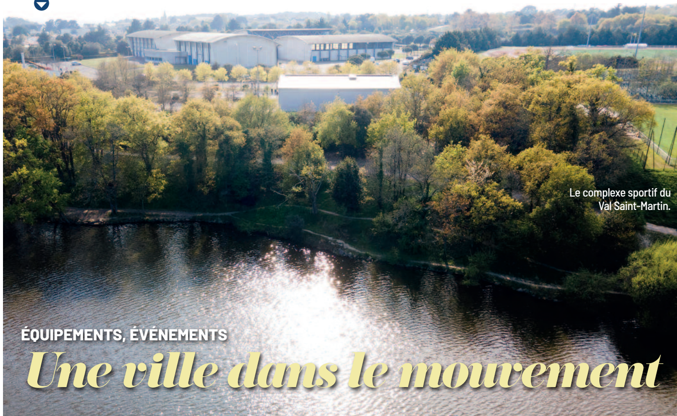
Le complexe sportif du Val Saint-Martin.