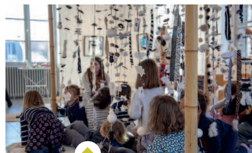
Du 31 janvier au 11 février, l'exposition Délicatesse proposée aux tout-petits de 3 mois à 4 ans à la Maison du Chapitre a remporté un beau succès auprès des 416 visiteurs.